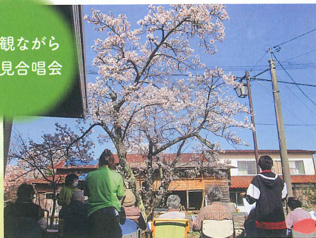
桜を観ながら お花見合唱会