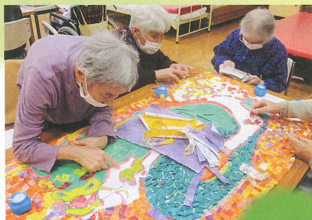
協力して 作品制作