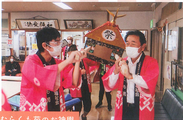
むらくも苑のお神輿