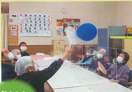
和やかな 雰囲気の中、 体を動かします