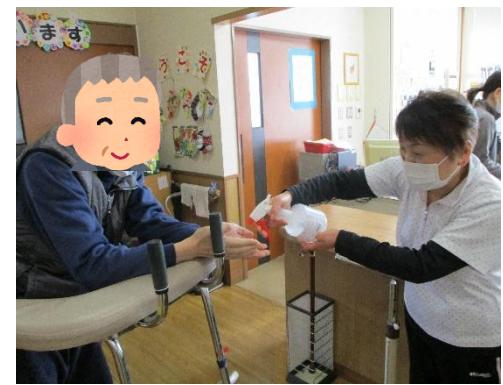
来所時のアルコール手指消毒