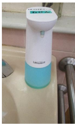
ソープディスペンサー