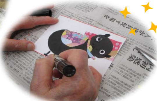
干支の絵手紙作り